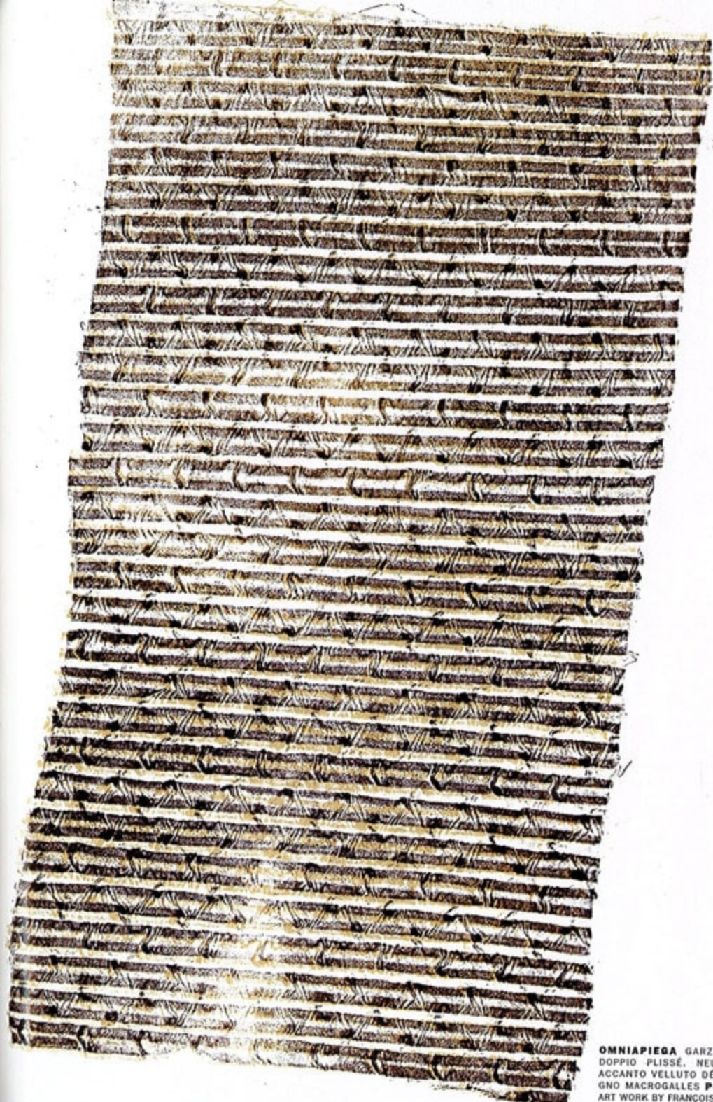
OMNIAPIEGA GARZA CRÉPE A DOPPIO PLISSÉ. NELLA PAGINA ACCANTO VELLUTO DÉVORÉ DISE- GNO MACROGALLES PONTOLIO. ART WORK BY FRANÇOIS BERTHOUD.